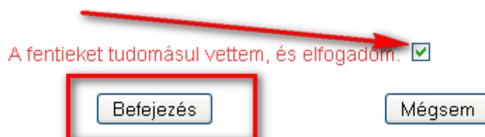
1.2 ábra: a Piacadat-terjesztési és Információ-szolgáltatási Keretszerződés elfogadásának lépései

A keretszerződés sikeres megkötéséről egy új ablakban előugró üzenet tájékoztatja a tisztelt Ügyfeleket. Itt olvasható a szerződés azonosító száma, és az érvényességének kezdeti dátuma is. Lásd 1.3 ábra.